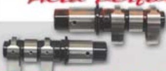
COMANDO TORNADO CRF 230/NX-XR 200 TECNOLOGIA ITALIANA MELHOR DESEMPENHO ROTAÇÕES + RÁPIDAS