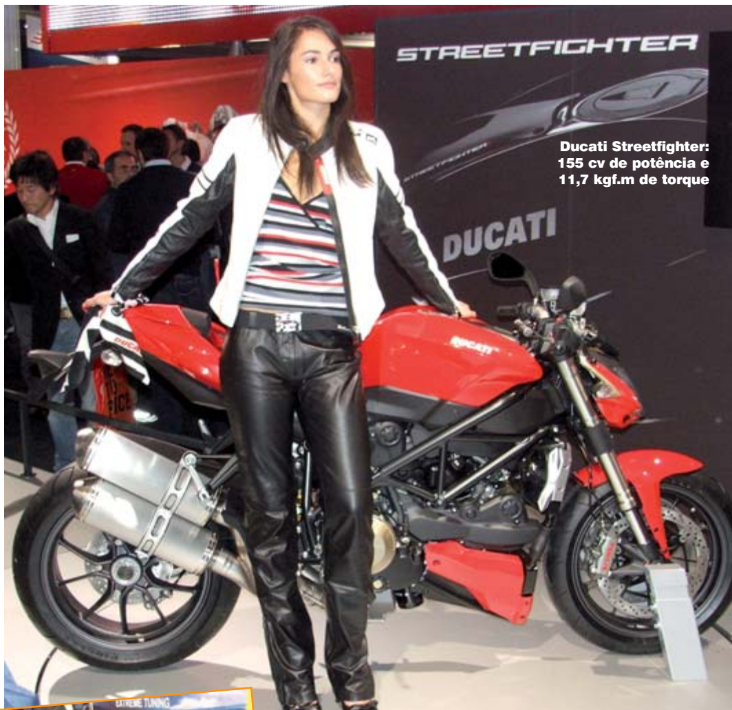
Ducati Streetfighter: 155 cv de potência e 11,7 kgf.m de torque