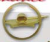
POWERJET SISTEMAS DE INJEÇÃO DE ALTA COM DIVISOR DE FLUXO EM BAIXA